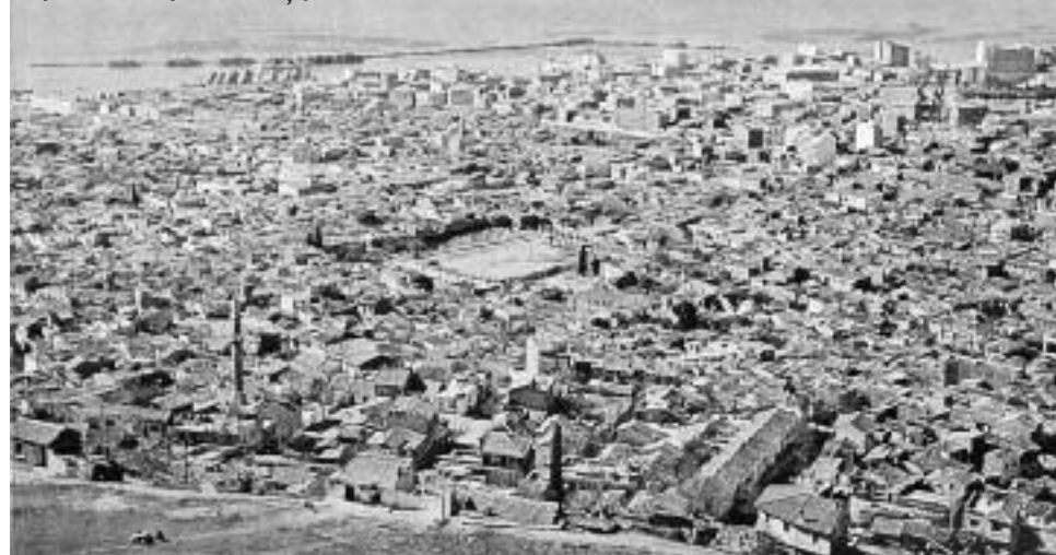
Πανόραμα της Σμύρνης το 1960 από τον λόφο Πάγος (Kadifekale) προς τον κόλπο και το φημισμένο προάστειο Κορδελιό (Karşıyaka).

σ' αυτούς που πουλούσαν αλιευτικά είδη. Εμείς όμως, για να μην δώσουμε λεφτά, τουλάχιστον για το δόλωμα, γνωρίζοντας μία ρηχή παραλία γεμάτη φύκια μέσα στα οποία υπήρχαν τα σκουληκάκια που τόσο πολύ άρεσαν στην τσιπούρα, μπαίναμε στο νερό με τα γυμνά μας πόδια και τα μαζεύαμε μόνοι μας.