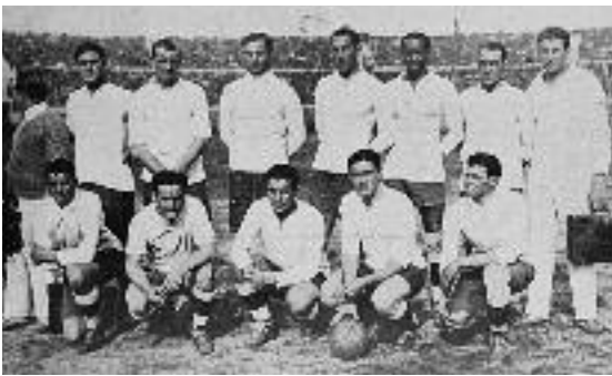
Η εθνική ομάδα της Ουρουγουάης που κατέκτησε τον τίτλο.

Β' Όμιλος: Γιουγκοσλαβία-Βραζιλία 2-1 με τέρματα των Timanic στο 21' και Bek στο 30'