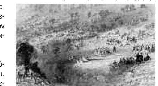
Γιορτή της Υπαπαντής στην Kaisariani, λιθογραφία.

Από το 1458 αρχίζει η περίοδος της οθωμανικής κυριαρχίας για την Αθήνα. Τον Υμηττό επισκέπτεται ο γνωστός τούρκος περιηγητής