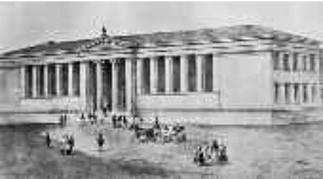
Πανεπιστήμιο 19ος αιώνας.

Ο Καβάφης στην Αθήνα Ο Καβάφης στη διάρκεια της ζωής του ελάχιστα φορές ταξίδεψε στο εσωτερικό (Κάιρο) και στο εξωτερικό. Το 1897 είχε πραγματοποιήσει ένα δίμηνο ταξίδι με τον αδελφό του Τζων στο Παρίσι και στο Λονδίνο. Το πρώτο ταξίδι του στην Αθήνα πραγματοποιείται το καλοκαίρι του 1901 και είναι ένα ταξίδι γνωριμίας του ποιητή με τον τόπο και τους ανθρώπους σε πραγματικό χρόνο. Η Αθήνα, μολοντί δεν αποπνέει την κοσμοπολίτικη αύρα της Αλεξάνδρειας ούτε της Κωνσταντινούπολης –πόλεις που αποτελούσαν τόπους αναφοράς του ποιητή– τον ελκύει ως «λίκνο του ευρωπαϊκού πολιτισμού» και ως πρωτεύουσα του νεαρού ακόμη ελληνικού κράτους, όπως και πολλούς Έλληνες του ευρύτερου Ελληνισμού.