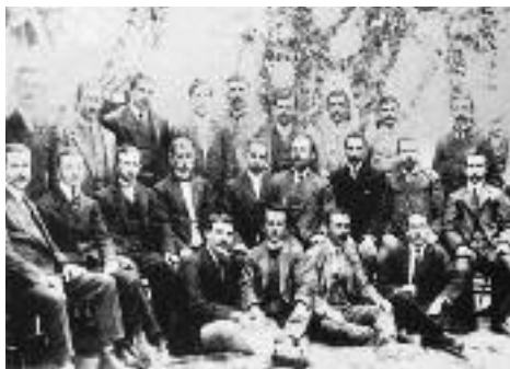
Η ηγεσία των γεωργικών συλλόγων της Θεσσαλίας.

Στο Κιλελέρ εκείνο το πρωινό περίπου δικάσιοι κολίγοι περιμένουν το τρένο για να μεταβούν στη Λάρισα. Όταν αυτό φτάνει στον σταθμό, προσπαθούν ν' ανέβουν χωρίς εισιτήριο, προπηλακίζονται από στρατιωτική δύναμη πενήντα ανδρών, δέχονται την πληρωμή του αντιτίμου αλλά αποβιβάζονται με βίαιο τρόπο, γεγονός που προκαλεί την οργή τους. Είναι αδύνατο να πάνε με τα πόδια. Γιουχαίνουν και πετροβολούν τον συρμό. Στο επόμενο χιλιόμετρο άλλοι οκτακόσιοι αγρότες προσπαθούν ν' ανέβουν σκαρφαλώνοντας στα βαγόνια. Ο στρατός πυροβολεί αφή-