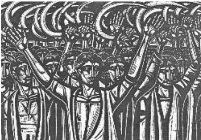
Χαρακτικό «Εξέγερση», Α. Τάσος.