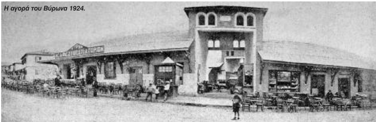
Η αγορά του Βύρωνα 1924.