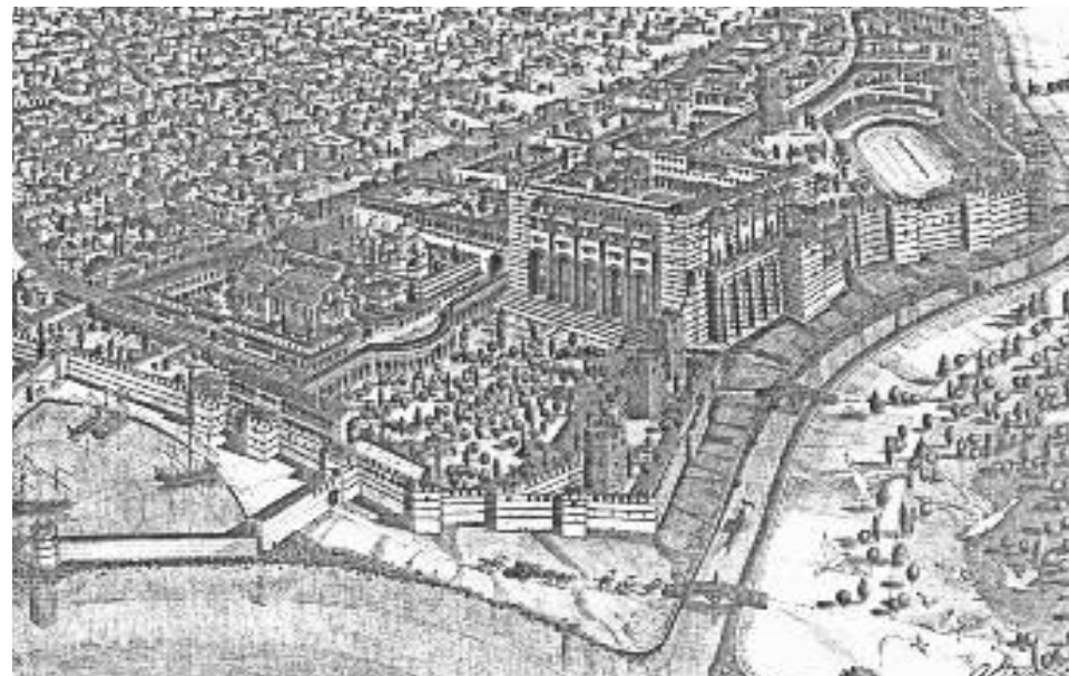
Βλαχέρνες. Το Β' Διοικητικό και Θρησκευτικό Κέντρο της Βυζαντινής Κωνσταντινούπολης όπως ήταν μέχρι τον 15ο αιώνα. Πανόραμα από ψηλά.

Ο Μανουήλ Α' Κομνηνός (1143-1180) κτίζει στα ενδότερα της συνοικίας νέα και πολύ ισχυρά τείχη με αποτέλεσμα να αυξήσει τον ζωτικό χώρο και να ενδυναμώσει την άμυνα της περιοχής.