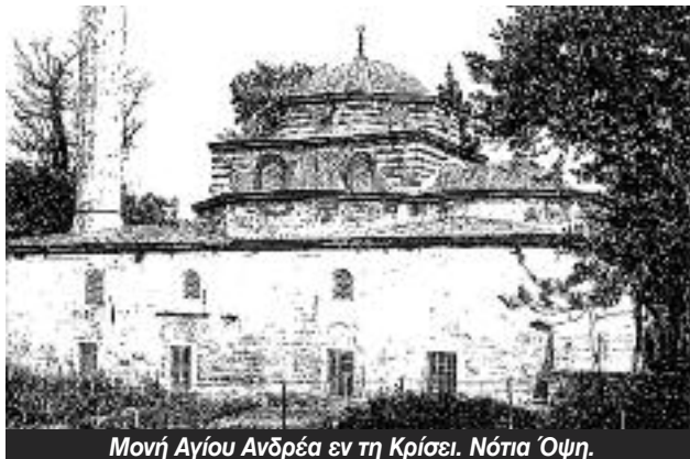
Μονή Αγίου Ανδρέα εν τη Κρίσει. Νότια Όψη.

Ως ιδρύτρια της μονής αναφέρεται η Αρκαδία, αδελφή του Αρκαδίου (395-408). Η εκκλησία αναστηλώθηκε επί Βασιλείου Α' του Μακεδόνα (867-886). Δεύτερη ανακαίνιση γίνεται λίγο μετά το 1284 από την πριγκίπισσα Θεοδώρα, μετά τις καταστροφές που είχαν προκληθεί επί Λατινοκρατίας. Η Μονή εξακολουθούσε να λειτουργεί και μετά την Άλωση μέχρι το 1489. Επί Bayazit Β' (1481-1512) ο Koca Mustafa Pasa τη μετέρεψε σε τζαμί.