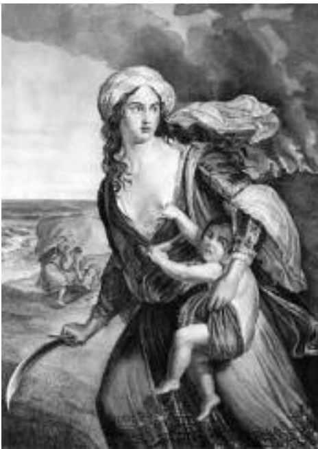
Η Λένω Μπότσαρη.

Η ηρωική καπετάνισσα Χαρίκλεια Δασκαλάκη ανδραγάθησε στο Αρκάδι και ήταν η ψυχή της άμυνάς του. Η ηρωίδα ήταν κόρη, σύζυγος και μητέρα αγωνιστών. Ο σύζυγός της Μιχαήλ Δασκαλάκης ήταν απόγονος του Δασκαλογιάννη. Και οι τρεις γιοι της έπεσαν σε μάχες του 1866. Κρητικά και η Χαρίκλεια δεν υστέρησε καθόλου από όλες τις άλλες καπετάνισσες του Αγώνα. Οι οπλαρχηγοί, όπως λέγεται πολλές φορές αποφάσιζαν με τη σύμφωνη γνώμη της Χαρίκλειας Δασκαλάκη η οποία συμμετείχε στα συμβούλια. Έτσι κι έγινε και τη φορά αυτή όταν ο Μουσταφά Πασάς μετέφερε από το Ρέθυμνο πυροβόλο μεγάλης ολκής, για να ρίξει τη σιδερένια πύλη της Μονής προεξάρχοντος του ηγούμενου Γαβριήλ, όπου 950 πολιορκημένοι βρίσκονταν στη Μονή. Η Χαρίκλεια Δασκαλάκη κλεισμέ-