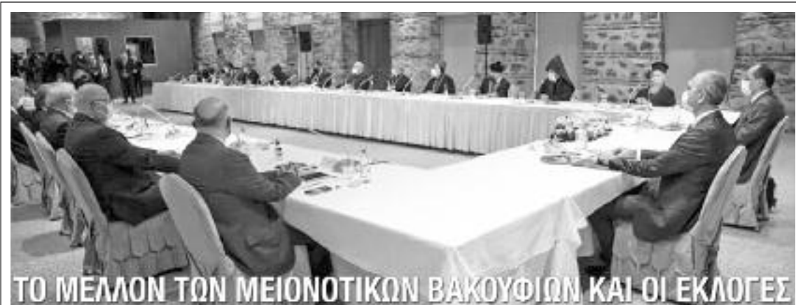
ΤΟ ΜΕΛΛΟΝ ΤΩΝ ΜΕΙΟΝΟΤΙΚΩΝ ΒΑΚΟΥΦΙΩΝ ΚΑΙ ΟΙ ΕΚΛΟΓΕΣ