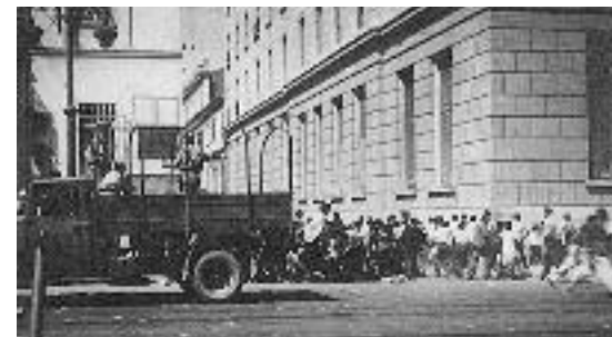
Πανεπιστημίου και Ομήρου, 22 Ιουλίου 1943.

Στην έκθεση τα σχετικά ντοκουμέντα και οι ιστορικές φωτογραφίες παραπέμπουν στα ηρωικά γεγονότα. Με θαυμασμό και δέος στεκόμαστε μπροστά στα νεανικά πρόσωπα αυτών που μας χάρισαν τη Λευτεριά μας. Χρέος να τους τιμάμε, να τους μνημονεύουμε και να μας εμπνέουν.