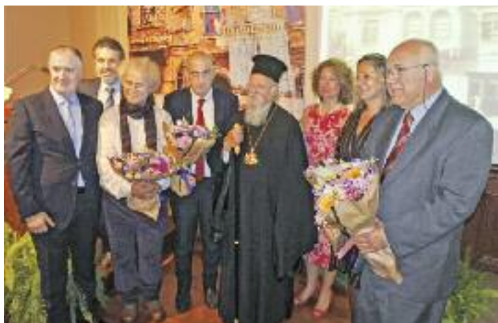
> Συνέχεια από τη σελίδα 15

Τέσσερα χρόνια είχα να επισκεφθώ την Πόλη. Τέσσερα χρόνια είναι πολύς καιρός... Και πήγα για έξι μέρες, που πέρασαν σαν μία!