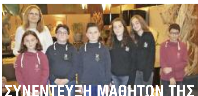
ΣΥΝΕΝΤΕΥΞΗ ΜΑΘΗΤΩΝ ΤΗΣ 6ΗΣ ΤΑΞΗΣ ΤΟΥ ΖΩΓΡΑΦΕΙΟΥ ΤΟΥ ΣΤΑΘΗ ΑΡΒΑΝΙΤΗ

ΜΑΥΡΟΜΙΧΑΛΗ 84 ■ Τ.Κ. 114 72 ΑΘΗΝΑ ■ ΙΑΝΟΥΑΡΙΟΣ 2020 ■ ΑΡ. ΦΥΛΛΟΥ 633 ■ 2,50 ΕΥΡΩ