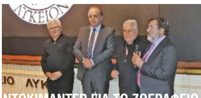
ΝΤΟΚΙΜΑΝΤΕΡ ΓΙΑ ΤΟ ΖΩΓΡΑΦΕΙΟ ΛΥΚΕΙΟ ΤΟΥ ΓΙΩΡΓΟΥ ΜΟΥΤΕΒΕΛΗ