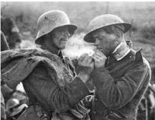
ΤΟΥ ΝΤΙΝΟΥ ΚΑΤΣΑΡΟΥ

Έχουν συμπληρωθεί πέντε μήνες από την έναρξη του Α΄ Παγκόσμιου Πολέμου μέχρι τη λήξη του 1914. Ουδείς αντικειμενικός σκοπός είχε επιτευχθεί και από τις δύο αντίπαλες παρατάξεις. «Ουδέν νεώτερον από το Δυτικόν Μέτωπο».