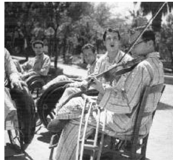
Νοσοκομείο Ελληνικού Ερυθρού Σταυρού, Αθήνα 1941.

Περίπου 1.300 ανάπηροι αιχμαλωτίστηκαν και οδηγήθηκαν στο Ορφανοτροφείο Χατζηκώνστα της οδού Πειραιώς που είχε μετατραπεί σε φυλακές υπό την διοίκηση της Χω-