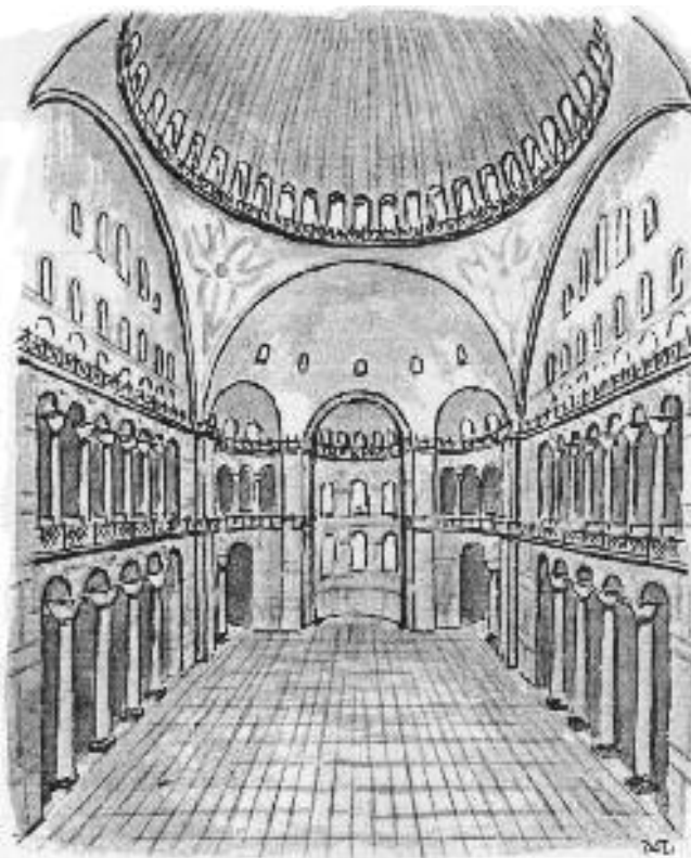
Το εσωτερικό της Αγίας Σοφίας. Σχέδιο Α. Πασαδαίου.

τρούλου και στη συνέχεια διαβαθμιζόταν μειωμένο προς τα κάτω. Μετά τη επιλογή των πολύχρωμων υλικών, τις καλογαλισμένες κολόνες, ορθομαρμαρώσεις και μαρμαρίνες δαπεδοστρώσεις (πολλές κολόνες και μάρμαρα, μετά από τόσους αιώνες φαίνονται να κατασκευάστηκαν και να γυαλίστηκαν πρόσφατα), κοίλες επιφάνειες καλυμμένες με χρυσές ψηφίδες, με τοιχογραφίες, κ.ά. όλα αυτά λοιπόν μέσα σε μία πανδαισία χρωμάτων και φωτός, συντελούν στην εξαύλωση του μεγαλειώδους οικοδομήματος, ώστε και ο πιστός χριστιανός μέσα εκεί να μην αισθάνεται σχεδόν καθόλου ότι περιβάλλεται από κολόνες, τοξοστοιχίες, αψίδες, ημιτρούλια και τον μεγάλο τρούλο, καθώς όλα αυτά φαίνονται να υποχωρούν, να χάνονται και να εξαυλώνονται. Ακόμη ο οποιοσδήποτε, μέσα σε αυτόν τον χώρο αντιλαμβάνεται τελικά