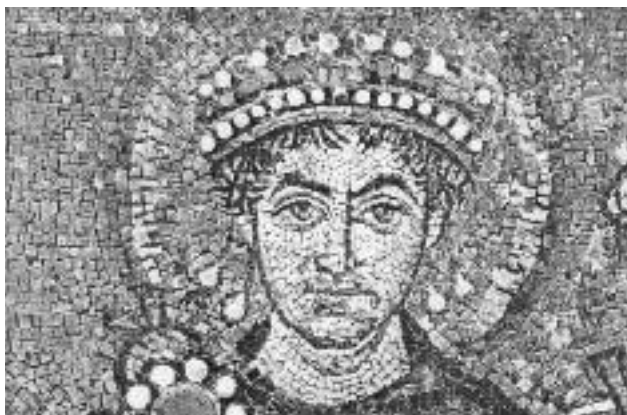
Ο Ιουστινιανός, ψηφιδωτό Αγίου Απολλινναρίου του νέου, Ραβέννα.

ε) Αλλά ακόμα και το πιο απειλητικό από άποψη στατικής αρχιτεκτονικό στοιχείο στο μέσο του κτίσματος, ο τρούλος δηλαδή, με το άνοιγμα στη βάση παραθύρων γύ-