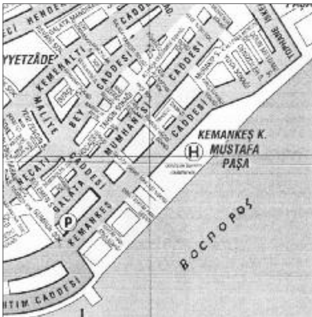
Τμήμα χάρτη του Γαλατά, όπου συγκεντρωμένες οι ορθόδοξες εκκλησίες, τα ρωσικά μετόχια κ.ά.

3) Οι πύργοι της ξηράς χρησιμοποιούνται πλέον ως ενδιαίτημα των Χριστιανών αιχμαλώτων που εργάζονται στα ναυπηγεία του