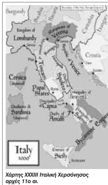
Χάρτης XXXIII Ιταλική Χερσόνησος αρχές 11ο αι.

Μέσα στη σύγχυση κατά πόσο θα μπορούσε να υπάρχουν δύο Αυτοκράτορες στα Χριστιανικά βασίλεια, εμφανίζεται μία επιπλέον σύγχυση περί ταυτότητας του Δυτικού Αυτοκράτορα, αλλά και κατά πόσο μπορούσε να εγείρει αξιώσεις κατά των υπολοίπων βα-