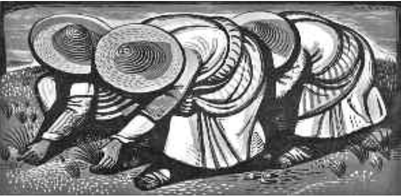
Χαρακτικό «ο Καρπός», Α. Τάσος.

Στις 31 Αυγούστου του 1881 ο ελληνικός στρατός, κατά τη σύμβαση της προσάρτησης, απελευθερώνει τη Λάρισα. Τις παραμονές της προσάρτησης Τούρκοι ιδιοκτήτες θεσσαλικής γης μεταβίβασαν άρον άρον τις ιδιοκτησίες τους σε Έλληνες, γηγενείς και ομογενείς.