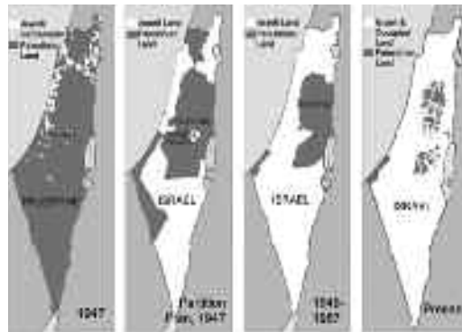
Η εικόνα δείχνει τι απέμεινε από την Παλαιστίνη. Πώς ήταν το 1947 και πώς κατέληξε σήμερα.

Η Γάζα, με τους περισσότερους κατοίκους της να είναι πρόσφυγες που δημιούργησε το Ισραήλ. Η Γάζα, η οποία δεν γνώρισε ποτέ ούτε μια μέρα ελευθερίας.