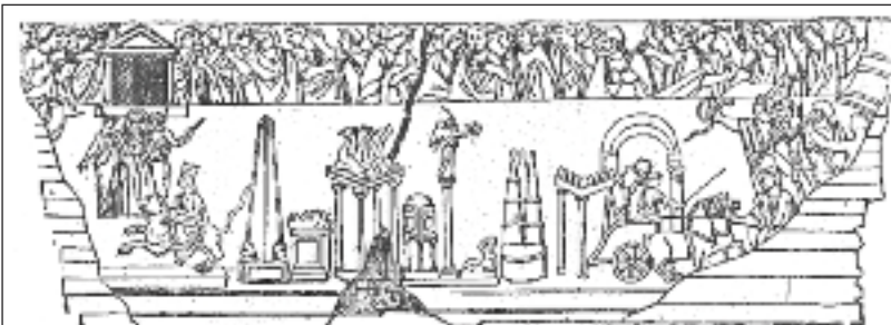
Η spina του Ιπποδρόμου και τα διάφορα μνημεία της.

ΤΟΥ ΓΕΩΡΓΙΟΥ ΑΝΑΠΝΙΩΤΗ Αρχιτέκτονα - Ερευνητή