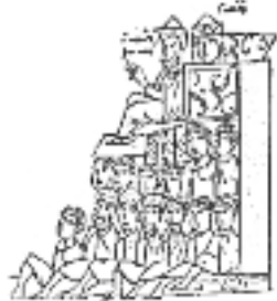
Ο βασιλιάς με τη βασίλισσα θεωρούν από το «Κάθισμα» του Ιπποδρόμου τα αγωνίσματα.

* Οι βυζαντινές μικρογραφίες, που παριστάνουν διάφορα δρώμενα στον Μεγάλο Ιππόδρομο αντλήθηκαν από τον Γ' τόμο του έργου του Φ. Κουκουλέ, Βυζαντινών Βίος και Πολιτισμός , εκδ. Παπαζήση.