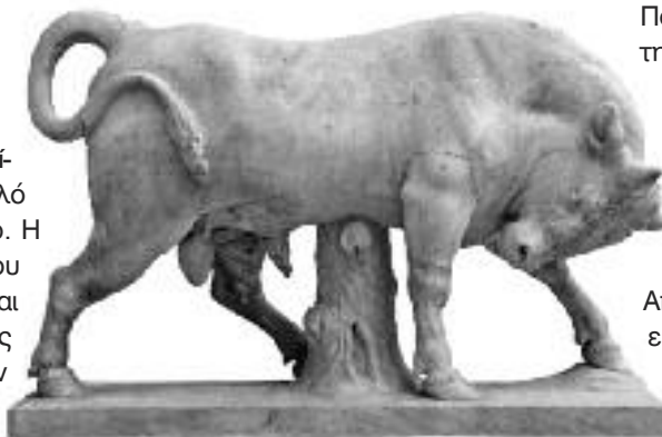
Ταύρος, Μουσείο Κεραμεικού.