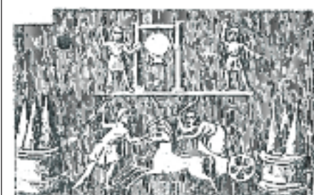
Κάτω, η παράσταση ενός τέθριππου άρματος με τους οβελίσκους των καμπών. Πάνω η κλήρωση των αγωνισμάτων.