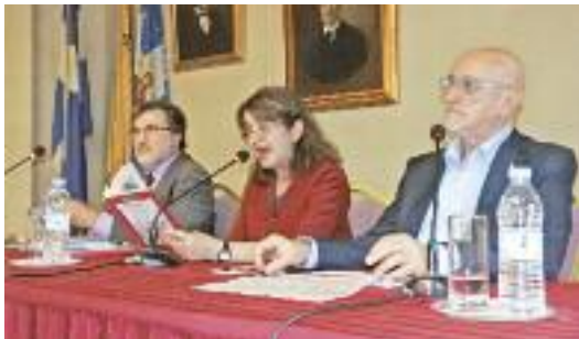
ΤΟΥ ΣΤΑΘΗ ΑΡΒΑΝΙΤΗ

Με μεγάλη επιτυχία και σε κλίμα συγκίνησης πραγματοποιήθηκε την Τέταρτη, 31 Μαΐου 2023 στην αίθουσα εκδηλώσεων «Αλέκος Μαζαράκης» του Πνευματικού Κέντρου Κωνσταντινουπολιτών, εκδήλωση μνήμης με τίτλο «570 χρόνια από το πάρσιμο της Πόλης», που οργάνωσαν η Ένωση Κωνσταντινουπολιτών, ο Σύνδεσμος των εν Ελλάδι Ζωγραφειωτών και οι εκδόσεις Ακρίτας.