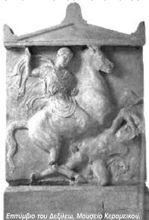
Επιτύμβιο του Δεξιλέου, Μουσείο Κεραμεικού.