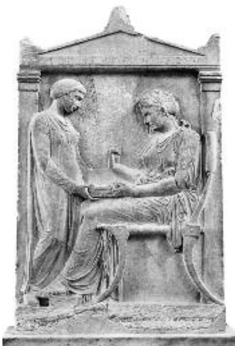
Επιτύμβια στήλη Ηγησούς, Εθν. Αρχ/κό Μουσείο.

ΤΗΣ ΚΑΛΛΙΟΠΗΣ ΜΑΖΟΚΟΠΟΥ Φιλολόγος - Ιστορικός