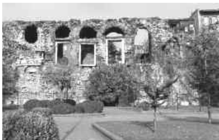
Κατάλοιπα του κεντρικού τμήματος του Παλατιού του Βουκολέοντος.

Στη δυτική προέκταση του παραθαλάσσιου τείχους και της πρόσοψης του παλατιού σχηματίζεται μία ορθή γωνία με ένα τείχος να προεξέχει καθέτως μέσα στη θάλασσα, που κατέληγε σ' έναν πύργο που αποκαλούνταν του Βελισσαρίου. Πίσω από τη γωνία που αναφέρθηκε δημιουργήθηκε, εσωτερικά, ένα μικρότερο τεχνητό λιμάνι, προφυλαγμένο και οχυρωμένο πολύ καλά. Η είσοδος στο μικρό λιμάνι φυλασσόταν από δύο πύργους. Οι Λατίνι την είσοδο αυτή την αποκαλούσαν Porta Leonis, οι δε Οθωμανοί αργότερα Catladi Kari, που σημαίνει ρηγματωμένη πύλη. Στο μικρό αυτό λιμάνι λιμενίζόταν οι αυτοκρατορικοί λέμβοι και δρόμωνες με τους οποίους οι βασιλείς και οι παλατιανοί γενικά εξερχόμενοι κάτω από το παλάτι και την κεντρική μεγάλη πύλη στη μαρμάρινη αποβάθρα πήγαιναν διά θαλάσσης στις Βλαχέρνες, στο Επταπύργιο και στις Πηγές (Μπαλουκλή), στην Ιερρεία της ασιατικής πλευράς κ.ά. Το