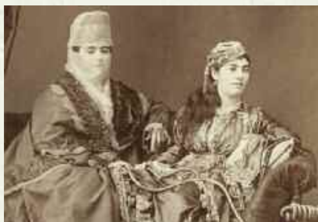
«Γυναίκες» στην Πόλη.