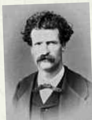
Ο Μάρκ Τουέην φωτογραφημένος από τους αδελφούς Αμπντούλάχ.

Α πό τις αρχές του 19ου αιώνα γίνονταν προσπάθειες μεταρρυθμίσεων και εξευρωπαϊσμού της Τουρκίας. Στα σουλτανικά παλάτια το ενδιαφέρον για τη ζωγραφική αυξήθηκε και μάλιστα κάποια μέλη της δυναστείας ξεκίνησαν να δείχνουν τις ζωγραφικές τους ικανότητες. Αυτού του είδους η ρεφορμιστική ατμόσφαιρα που επικράτησε, συνέβαλε στην αποδοχή της φωτογραφίας από τα ανώτερα Οθωμανικά στρώματα και το Παλάτι.