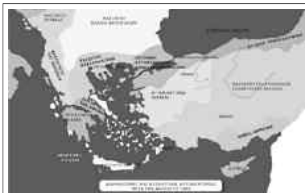
Χάρτης XXIV: Διαμελισμός του Βυζαντίου μετά το 1204.

Σε όλο τον 13ο αι. υπήρξαν συνεχείς μάχες και διαπληκτισμοί μεταξύ των προαναφερόμενων κρατών, μεταξύ των οποίων συστήνονταν πρόσκαιρες διεθνείς συμμαχίες, που εύκολα δημιουργούνταν και εύκολα διαλύονταν. 135