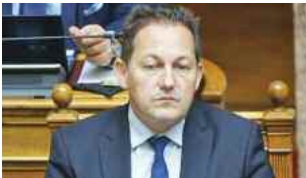
ΤΟΥ ΧΑΡΗ ΓΑΝΤΖΟΥΛΗ

Για την δήλωση του Αναπληρωτή Υπουργού Εσωτερικών Στέλιου Πέτσα στο πρωινό πρόγραμμα του ANT1 σου γράφω τόση ώρα, αγαπημένε μου αναγνώστη. Πιο συγκεκριμένα ο Υπουργός βρέθηκε καλεσμένος του Γιώργου Παπαδάκη για να μιλήσει για την ενέργεια, την αύξηση της τιμής του φυσικού αερίου και για το τι μπορούμε να κάνουμε ώστε ο χειμώνας που έρχεται να είναι βιώσιμος, δηλαδή να μην γίνουμε παγοκολόνες. Και φυσικά ο Υπουργός είχε λύσεις και σχέδιο, αγαπημένε μου αναγνώστη. Πρότεινε να μεταβούμε από το φυσικό αέριο στο πετρέλαιο η τιμή του οποίου είναι καλύτερη. Ερωτηθείς από δημοσιογράφο αν η κυβέρνηση έχει κάποιο σχέδιο, κάποια λύση ώστε αυτή η μετάβαση να μην επιβαρύνει την τσέπη των πολιτών ο Υπουργός δήλωσε: «Το βασικό ζητούμενο σε αυτές τις περιπτώσεις είναι να δείχνουμε προσαρμογή. Όποιος αρνείται να προσαρμοστεί, δυστυχώς πεθαίνει». Και με αυτή τη δήλωση άνοιξε ο ασκός του Αιόλου, αγαπημένε μου αναγνώστη. Αντιπολίτευση, κόμματα και πολίτες έσπευσαν να τον κατακραυ-