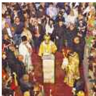
ΠΑΣΧΑΛΙΝΟΙ ΕΟΡΤΑΣΜΟΙ ΣΤΟ ΠΕΡΑ

ΜΑΥΡΟΜΙΧΑΛΗ 84 ■ Τ.Κ. 114 72 ΑΘΗΝΑ ■ ΙΟΥΝΙΟΣ 2022 ■ ΑΡ. ΦΥΛΛΟΥ 661 ■ 2,50 ΕΥΡΩ