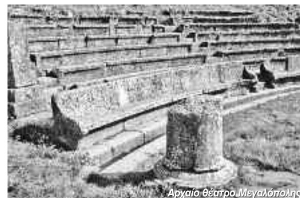
Αρχαίο θέατρο Μεγαλόπολης.

Ο θηβαίος στρατηγός Επαμεινώνδας παρότρυνε τους Αρκάδες, οι οποίοι είχαν συχνές συγκρούσεις με τους Λακεδαιμόνιους, να συννοικιστούν με σκοπό να ενδυναμωθούν ώστε να μπορούν να τους αντιμετωπίσουν αποτελεσματικά. Πράγματι, οι Αρκάδες επειδή φοβούνταν αλλά και επειδή μισούσαν τους Λακεδαιμόνιους, αποφάσισαν να εγκαταλείψουν τις ιδιαίτερες πατρίδες – πόλεις τους, να εκλέξουν οικιστές και να συγκεντρωθούν στη νέα