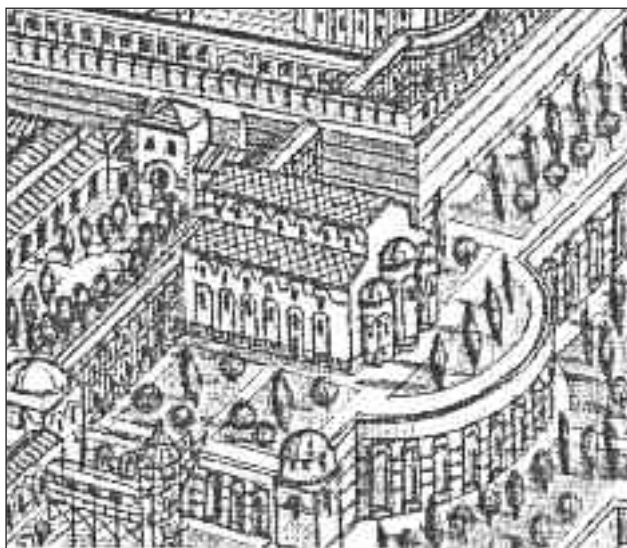
Η Μαγναύρα από ψηλά. Στ' αριστερά η Μικρή Χαλκή Πύλη και η δεντροστοιχία, δεξιά ο κυκλικός ηλιακός-ταράτσα. Σχέδιο Γ. Αναπνιώτη.

Ο ανατολικός είχε ιδιωτικό χαρακτήρα με κυκλικό σχήμα,