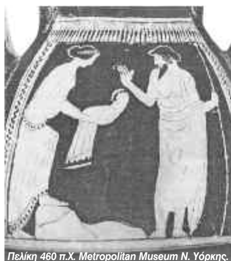
Πελίκη 460 π.Χ. Metropolitan Museum N. Υόρκης.

τική γη, η οποία χρησίμευσε σαν υπόδειγμα για τη δημιουργία των άλλων πόλεων. Αυτός καθιέρωσε τη λατρεία του Λυκαίου Δία και τους προς τιμήν του αγώνες, τα Λύκαιο. Ήταν τότε που οι Τιτάνες είχαν φυλακιστεί στα έγκατα της Γης από τον πατέρα τους Ουρανό χωρίς να βλέπουν ποτέ το φως της μέ-