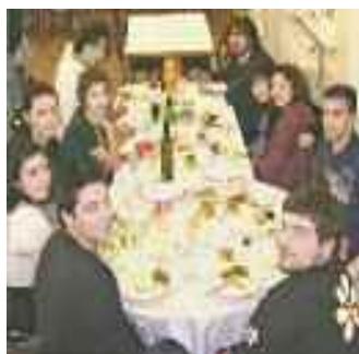
ΑΝΑΜΝΗΣΕΙΣ ΑΠΟ ΤΗΝ ΕΚΔΡΟΜΗ ΣΤΗΝ ΚΩΝ/ΠΟΛΗ ΤΟ 2008