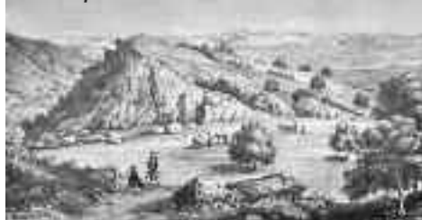
Λυκόσουρα Ed. Dodwell 1831.

τική γη, η οποία χρησίμευσε σαν υπόδειγμα για τη δημιουργία των άλλων πόλεων. Αυτός καθιέρωσε τη λατρεία του Λυκαίου Δία και τους προς τιμήν του αγώνες, τα Λύκαιο. Ήταν τότε που οι Τιτάνες είχαν φυλακιστεί στα έγκατα της Γης από τον πατέρα τους Ουρανό χωρίς να βλέπουν ποτέ το φως της μέ-