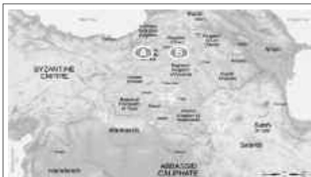
Χάρτη XVIII: Το Αρμένικο βασίλειο των Βαγκρατιδών 1.000 μ.Χ. Α κηλίδα Άρτζε - Β κηλίδα Άνιον (Ani). Διαμόρφωση: Β. Κυρατζόπουλος.

Τα αγαθά που έρχονταν από Ινδίες και Άπω Ανατολή, όσα δεν μεταφέρονταν από τον εμπορικό δρόμο του Βόλγα, μεταφέρονταν όλες τις εποχές του έτους μέσω Εύξεινου Πόντου και Δούναβη μέχρι την Κεντρική Ευρώπη από Έλληνες, και Αρμένιους εμπόρους. Τα κομβικά σημεία της διακλάδωσης που ακολουθούσαν τα εμπορικά καραβάνια ήταν: